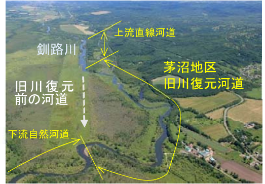
写真-1 釧路川茅沼地区 (2015.7 撮影)

旧川復元前の河道は川幅が広く直線であったのに対し旧川復元により川幅が狭く蛇行している状態となった。このため旧川復元後は川幅縮小により水深の増加から掃流力が增加することで河床地形の変化が活発になり、湾曲部の洗掘と堆積により幅広い水深・流速の場が形成されること、また河道物理環境の多様化により生息する魚類の多様化が期待された。旧川復元による河道物理環境の変化は、旧川復元区間より上流の直線河道区間と旧川復元区間の横断面の水深・流速計測値の比較で確認した。図-1に水深の多様さを例として示す。旧川復元区間の上流側直線区間では水深はほぼ0.0-0.5mに分布しているのに対し、旧川復元区間では0.0-1.2m程度まで幅広く分布している。直線区間は浅い一様な河道であり、旧川復元区間は浅い場所から深い場所まで多くの環境が形成されたこと、旧川復元区間の水深分布が下流自然河道区間の水深分布に類似してきたことがわかる。流速についても直線区間より旧川復元区間で幅のある値の分布となり、下流自然河道区間の分布に類似してきた結果が得られている。河道物理環境の変化の目標を下流自然河道区間と