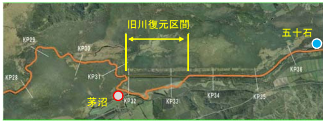
図2 流量・浮遊砂量観測地点位置図