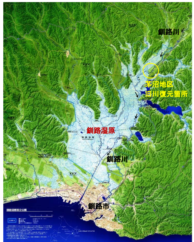
図1 釧路湿原と茅沼地区の位置図

ている. 旧川復元区間の上流側地点は五十石, 下流側地点は茅沼であり, これらで旧川復元区間の前後の流量と浮遊砂量の変化を確認することができる.