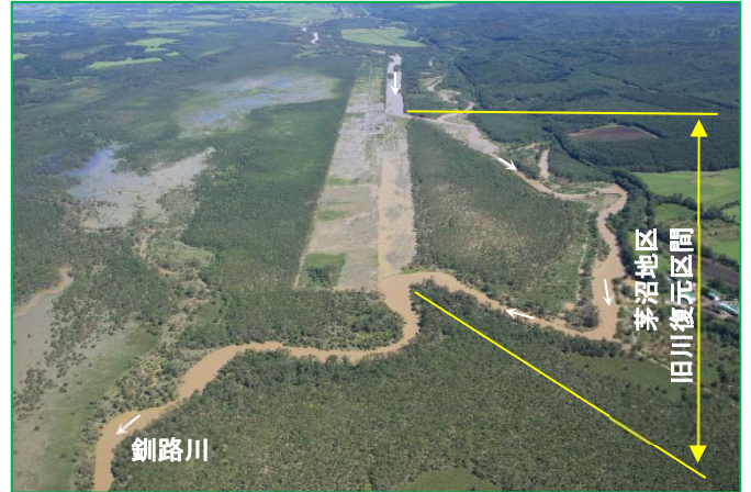
写真1 2016年8月洪水時の旧川復元区間での氾濫

2010年2月の旧川への通水後, 洪水時の旧川復元区間での氾濫と流下浮遊砂量の変化を確認する目的で 図2 に示す地点で流量及び浮遊砂量の観測を行っ