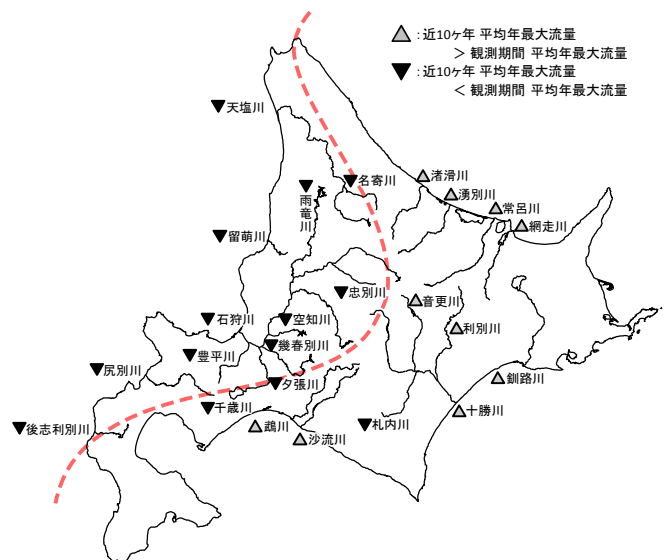
図 2 北海道内一級河川の平均年最大流量増減区分図 (区分線は図 1 と同じ)

近年の降雨量の地域分布の偏りに伴って河川の洪水流量も変化しているか、観測流量を整理して確認した。国土交通省水文水質データベース 3) から、北海道内の一級河川の基準地点の観測流量データを取得し、年最大流量について観測期間を通じた平均年最大流量と最近 10 年の平均年最大流量を算出した。これらと比較して増加・傾向を図示したものが図 2 である。これより流量の地域傾向として常呂川など北海道の東側地域に位置する河川では近年の年最大流量が増加傾向にあり、石狩川など西側地域の河川では減少傾向にあることがわかる。観測流量はダムによる洪水調節を含んだデータであるものの、図 1 の降雨の区分線を河川位置に重ねても年最大流量の増減の分布が区分線で分けられることから、洪水の傾向が降雨の傾向と概ね合致していることがわかる。