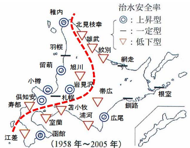
図 1 年最大日雨量の回帰直線の傾きによる治水安全率の変化傾向(佐渡・杉山 1) の図に区分線記入)

北海道の降水特性の経年変化については佐渡・杉山 1) の既往研究成果を引用する。同研究では北海道内 22 気象官署について、統計開始年から 2005 年までの年最大日雨量データの 1 次回帰直線の傾きから降雨の変化傾向を整理し、降雨の増加・減少傾向をそれぞれ治水安全率の低下・上昇として示している。この結果を図 1 に示す。これより治水安全率の北海道内の分布傾向を整理すると、稚内、留萌、小樽等の日本海方面を中心とした西側は上昇型が多く、紋別、北見枝幸等のオホーツク海側や十勝・釧路地方など東側は低下型であることがわかる。つまり日雨量で見れば、降雨量が北海道の西側では低下しているが、東側では増加しているという近年の傾向を裏付ける結果となっている。さらにこの傾向を示す区分線を追加記入すると、この線は北海道中央分水嶺にほぼ一致し、北海道の降雨の傾向が概ね東西に分かれることが示される 2) 。